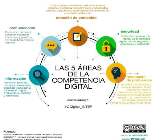
Figura 1. Infografía de las 5 áreas de la Competencia Digital (INTEF, 2017).

La CD en base a aquest marc ha d'estar desenvolupada a totes les etapes educatives, Educació Infantil, educació primària, educació secundària i a les etapes pots obligatòries.