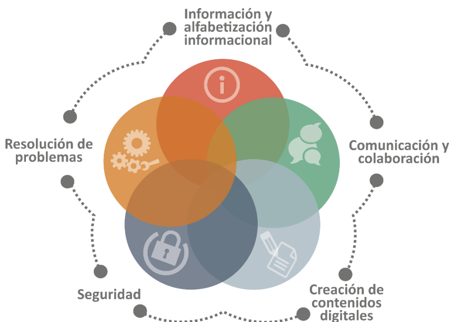
Figura 2. DIGCOMP v2.2. Marco de la Competencia Digital para la Ciudadanía (2022).

La gran majoria d'aquests marcs es basen en DigComp 2.2: Marc de la Competència Digital per a la Ciutadania (Vuorikari et al, 2022). Aquest marc proporciona la descripció detallada de totes les habilitats necessàries per a ser competent en entorns digitals i les descriu com a coneixements, habilitats i actituds aportant els nivells dins de cada una de les competències.